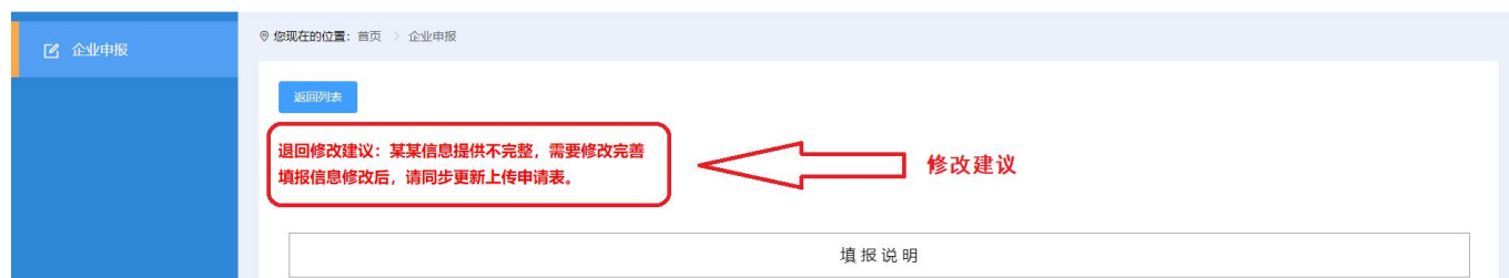
图 2-4 企业申报-退回修改