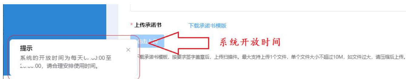
图 2-9 系统开放时间

点击“企业申报”模块名称，进入列表页面。点击【添加】按钮进入信息填报页面。请认真阅读“填报说明”关于填报时间、政策要求等相关信息。申报企业应在规定时限内提交申报材料，逾期系统将关闭通道。同时，本系统会结合实际工作安排，适时关闭夜间访问，请申报企业合理安排使用时间。