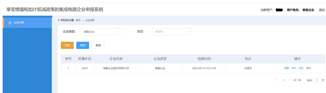
图 2-3 企业申报-列表页面

特别建议：因填报和提交的扫描文件较多，相关内容可能需要企业多个部门协同完成。因此建议正式申报之前，应点击【添加】按钮，记录申报页面需要填报和提交的扫描文件，分发给各部门筹备，指定负责人收集相关资料后统一进行申报操作。